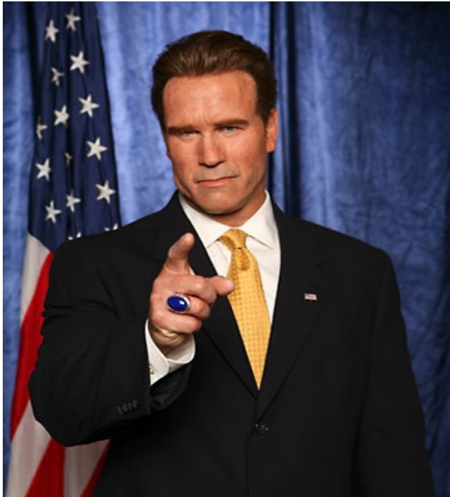
"I'll Be Back"